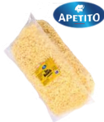
Mozzarella granulki opak.: 3 kg