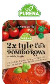
Zupa pomidorowa krem