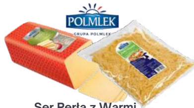
Ser Perta z Warmi blok i wiorki