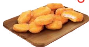
chrupiące nuggetsy z kurczaka