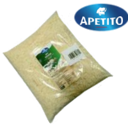
Gouda wiórki opak.: 2 kg