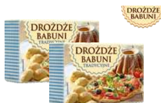
Drożdże babuni tradycyjne