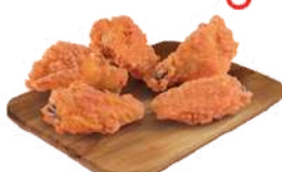
Skrzydeltka z kurczaka pikantne panierowane