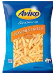
Pommes Frites 15mm