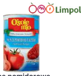
Pulpa pomidorowa O'Sole Mio opak.: 4050 g