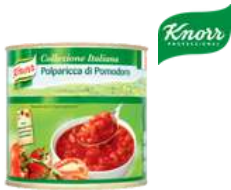
Pomidory kostka opak.: 2550 g