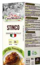
Golonka włoska gotowana