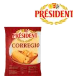
Ser typu parmezan Corregio