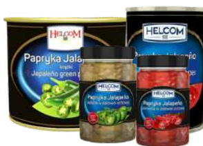
Jalapeno zielona i czerwona krazki