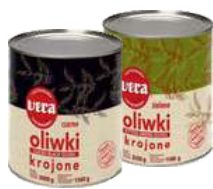
Oliwki zielone i czarne krojone