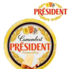
Ser pleśniowy Camembert