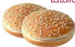
Hamburger 140g, 126g, 86g