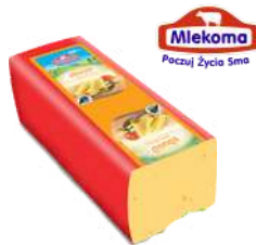
Ser Gouda blok opak.: ok. 3 kg