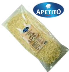
Mozzarella kostka opak.: 2 kg