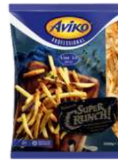
Premium Super Crunch Fries 9,5mm skin on