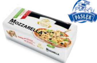
Ser Mozzarella blok