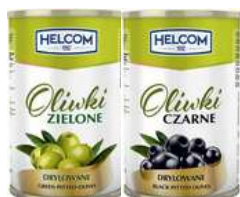
Oliwki zielone i czarne drylowane