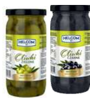
Oliwki zielone i czarne drylowane