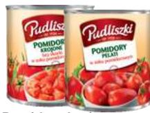
Pomidory krojone, Pomidory pelati opak.: 2500 g