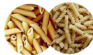
Makaron rurki mediterranea filini i świderki