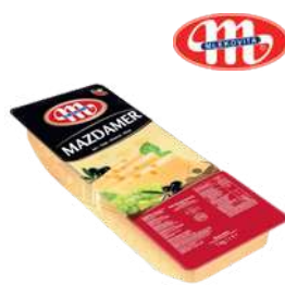
Ser Mazdamer plastry