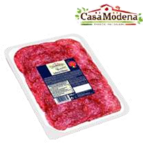
Salami Milano plastry