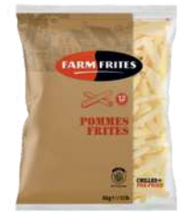
Fries 12mm Belgijskie świeże/chtłodzone