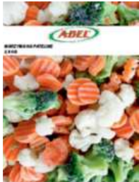
Warzywa na patelnię opak.: 2,5 kg