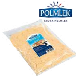
Mozzarella wiórki opak.: 2 kg