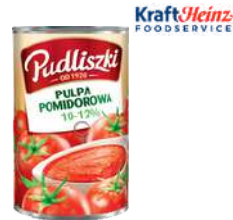
Pulpa pomidorowa 10-12% opak.: 200 g, 4000 g