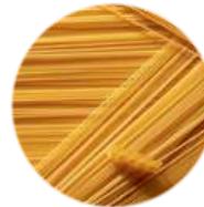
Makaron spaghetti mediterranea