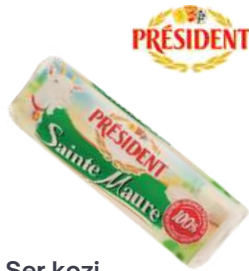
Ser kozi Sainte Maure Chevre