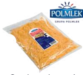
Gouda gastronomiczna wiórki opak.: 3 kg