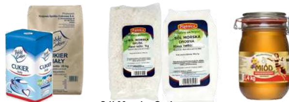
Cukier biały kryształ i Drobna opak.: 1 kg, 25kg