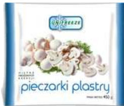
Pieczarki plastry opak.: 2,5 kg