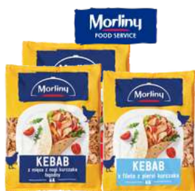
Kebab z kurczaka krojony, pikantny, z fileta