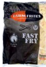
Fast Fry 10mm