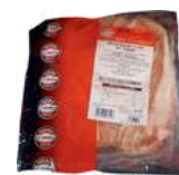
Boczek wędzony extra plastry opak.: ok. 1 kg