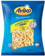
Turbo Classic Zig Zag