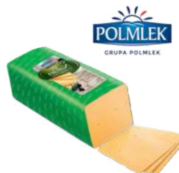
Ser Natan Warmia opak.: ok. 3 kg