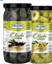
Oliwki zielone i czarne cięte