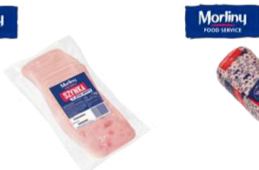
Szyńka na pizzę plastry Szyńka na pizzę blok opak.: ok. 1 kg opak.: ok. 3 kg