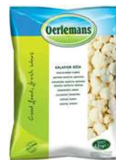
Kalafior róża opak.: 2,5 kg