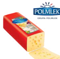
Ser Mlekdamer Warmia opak.: ok. 3 kg