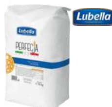
Mąka pszenna na pizzę