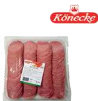
Salami kulinarne opak.: ok. 1 kg