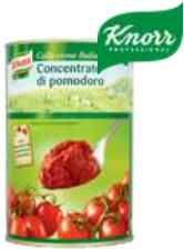
Koncentrat pomidorowy opak.: 800g, 4550g