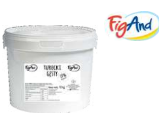
Jogurt turecki gęsty