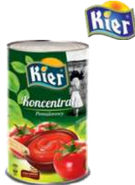
Koncentrat pomidorowy opak.: 4500 g