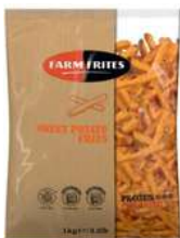
Sweet potato fries 9mm