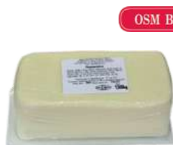
Ser Mozzarella blok