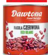
Fasola czerwona, czarna, pinto