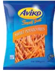
Premium Sweet Potato Fries 9,5mm