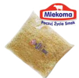
Gouda wiórki opak.: 2 kg