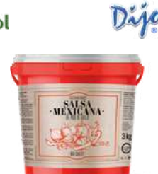
Sos salsa mexicana opak.: 3000 g