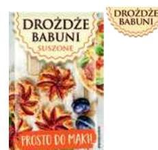
Drożdże babuni suszone