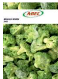
Brokuły opak.: 2 kg