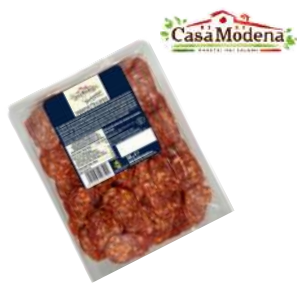
Salami Picante plastry