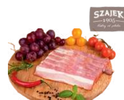
Boczek parzony w plastrach opak.: ok. 1,1 kg