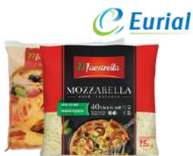
Mozzarella Maestrella granulki i wiórki opak.: 2,5 kg