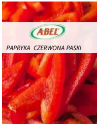
Papryka czerwona paski opak.: 2,5 kg