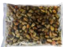
Mięso z małży 200/300 opak.: 1 kg