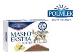
Masło extra 200g