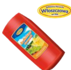
Ser Mazdamer blok opak.: ok. 4 kg