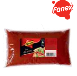
Sos do pizzy opak.: 3000 g