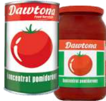
Koncentrat pomidorowy opak.: 4500 g, 1 kg