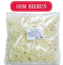
Mozzarella wiórki opak.: 2 kg