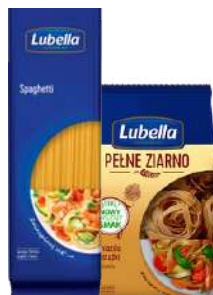
Makaron spaghetti, penne ziarno