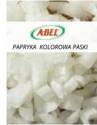
Cebula cięta opak.: 2,5 kg