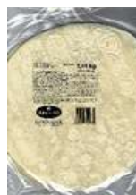
Tortilla wraps 30 cm