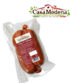
NDUJA di Spilinga