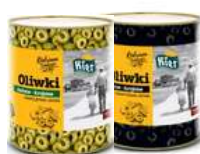
Oliwki zielone i czarne krojone