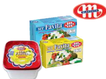
Ser Favita 12% i 18%