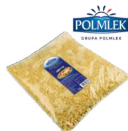
Mieszanka Top Pizza opak.: 3 kg