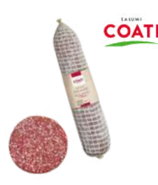
Salami Milano baton