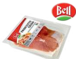
Szyńka Prosciutto Crudo opak.: 500 g