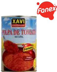
Pulpa pomidorowa opak.: ok. 4000 g