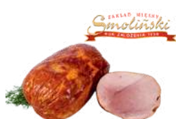
Ogonówka wielkopolska opak.: ok. 1,2 kg