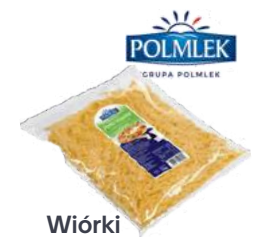
Wiórki seropodobne Perta Warmii opak.: 2 kg