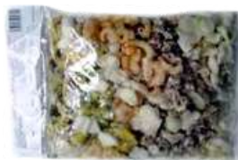
Frutti di mare