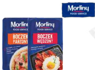
Boczek parzony plastry Boczek wędzony plastry opak.: ok. 1 kg