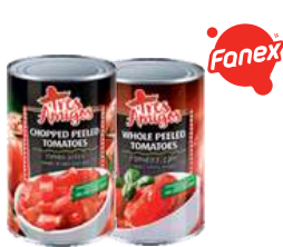
Pomidory bez skórki całe i kawałki opak.: 2650 g