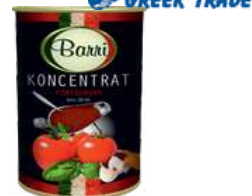
Koncentrat pom. 28-30% opak.: 4250 g