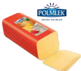
Ser Edamski Warmia opak.: ok. 3 kg