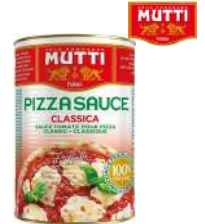
Sos do pizzy opak.: 1 kg