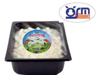
Mozzarella w zalewie kulku