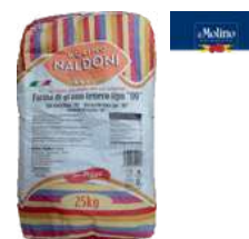
Mąka włoska na pizzę