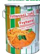
Frytura 100% olej palmowy