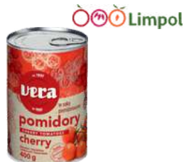
Pomidory konserwowe całe i kawałki opak.: 2550 g