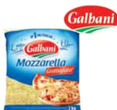
Mozzarella granulki opak.: 2 kg