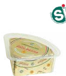
Gorgonzola Dolce Panna