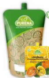
Koncentrat lemoniady różne smaki