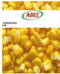
Kukurydza ziarno opak.: 2,5 kg