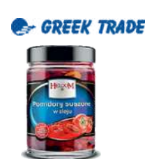
Pomidory suszone całe i paski opak.: 650g, 1600 g