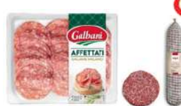
Salami Milano opak.: 100 g, 3,5 kg