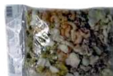
Mieszanka morsk opak.: 1 kg