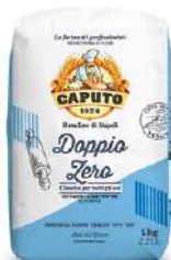
Mąka włoska Caputo