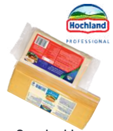
Ser cheddar plastry