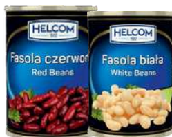
Fasola czerwona, biala, cannellini