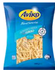
Turbo Classic Pommes Frites 10mm