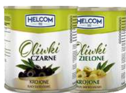
Oliwki zielone i czarne cięte