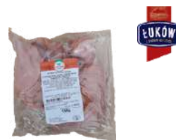
Szyńka wieprzowa parzona plastry opak.: ok. 1 kg