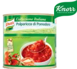
Tomato Pronto opak.: 2 kg