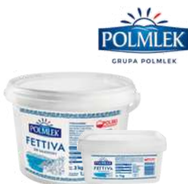
Ser sałatkowy Fettiva