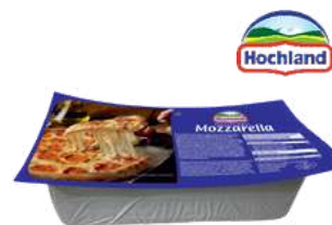
Ser Mozzarella blok