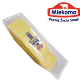
Ser Gouda plastry