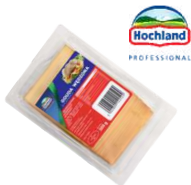
Ser Gouda wędzona