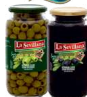
Oliwki zielone i czarne drylowane