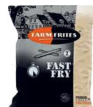
Fast Fry 7mm