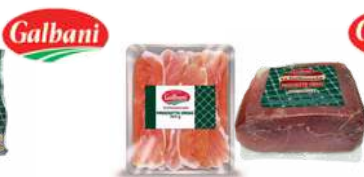
Prosciutto Crudo opak.: 500 g, 2 kg