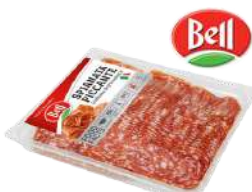
Spianata Picante opak.: 500 g