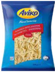
Pommes Frites Julienne Allumettes 7mm