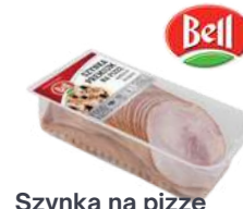
Szyńka na pizzę premium opak.: 1 kg