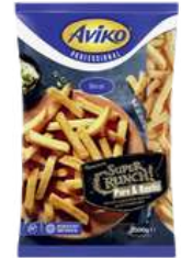
Super Crunch Pure & Rustic skin on