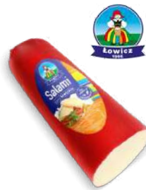
Ser Salami blok opak.: ok. 1,5 kg