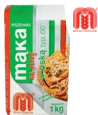
Mąka pszenna na pizzę włoską