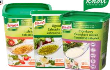
Sos sałatkowy ogrodowy, włoski, czosnkowy