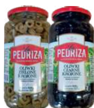
Oliwki zielone i czarne cięte