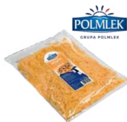
Mieszanka margerita wiórki opak.: 2 kg