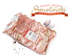
Boczek prasowany opak.: ok. 1 kg