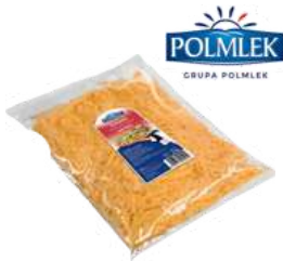
Gouda wiórki opak.: 2 kg