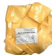
Okrawy sera holenderskiego opak.: ok. 3,5 kg