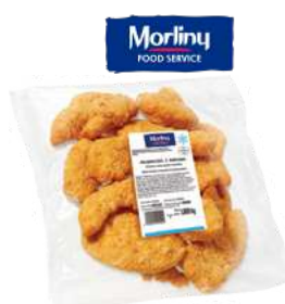
Połowiczki panierowane całomięsniowe