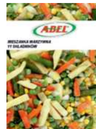
Mieszanka warzywna 11 składników opak.: 2,5 kg