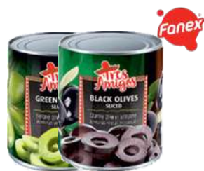
Oliwki czarne i zielone cięte