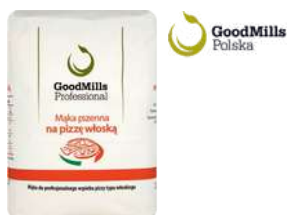
Mąka pszenna na pizzę włoską