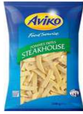
Pommes Frites Steakhouse