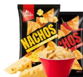
Nachos Tres Amigos serowe, bekonowe, solone, chilli