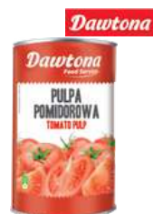
Pulpa pomidorowa opak.: 4200 g