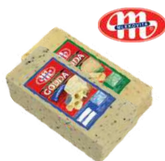
Ser Gouda z czarnuszką/ kozieradką blok opak.: ok. 3 kg