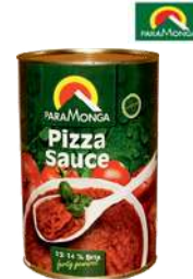
Sos do pizzy opak.: 4250 g