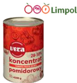
Koncentrat pom.28%30% opak.: 4500 g