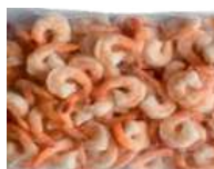
Krewetki tygrysie gotowane z ogonem opak.: 1 kg