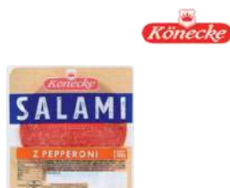
Salami pepperoni opak.: ok. 1 kg