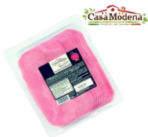
Prosciutto Cotto GSI