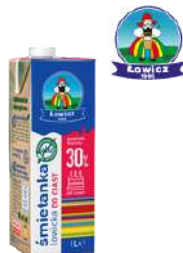
Łowicka UHT 18% 30% 36%