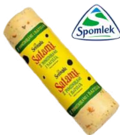
Salami smakowe blok opak.: ok. 1,5 kg