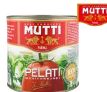
Pomidory pelati opak.: 2500 g