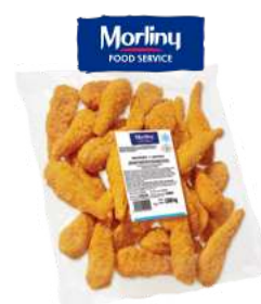
Newyorkery z kurczaka