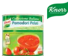
Pomidory pelati opak.: 2500 g