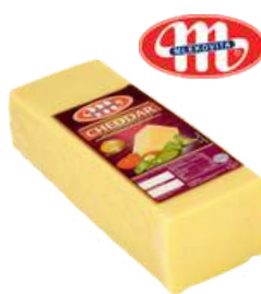
Ser Cheddar blok opak.: ok. 1,5 kg