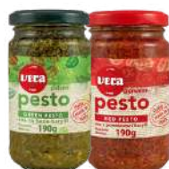
Pesto zielone i czerwone