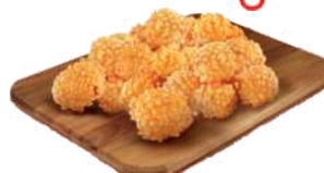
Popsy z kurczaka