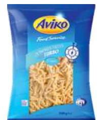
Turbo Classic Pommes Frites 7mm