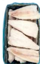
Dorsz filet opak.: 6,8 kg