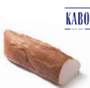
Polędwica sopocka opak.: 1,6 kg