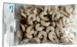
Krewetki tygrysie surowe z ogonem opak.: 1 kg