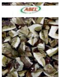
Grzyby mrożone opak.: 2,5 kg