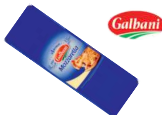
Ser Mozzarella blok