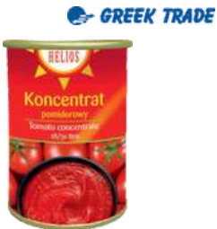
Koncentrat pom. 28 30% opak.: 4250 g