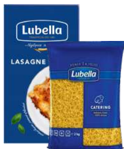
Makaron świderki, lasagne