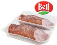
Szyńka konserwowa opak.: ok. 1 kg