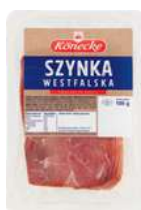
Szyńka westfalska opak.: ok. 100 g