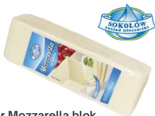
Ser Mozzarella blok