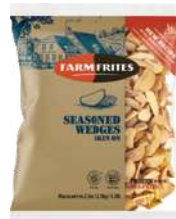
Seasoned Wedges Skin On