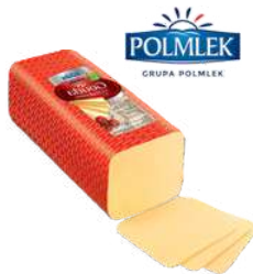
Ser Gouda blok opak.: ok. 3 kg