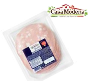
Mortadela z pistacjami