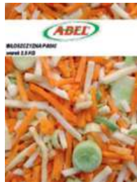
Włoszczyzna paski opak.: 2,5 kg