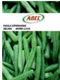
Fasola szparagowa zielona/żółta opak.: 2,5 kg