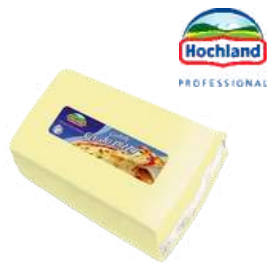
Ser do pizzy Cagliata