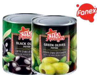
Oliwki zielone i czarne drylowane