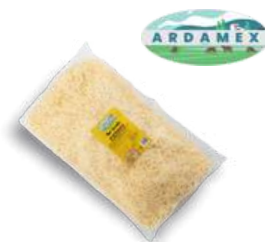
Gouda wiórki opak.: 3 kg