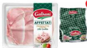
Prosciutto Cotto opak.: 100 g, 2 kg