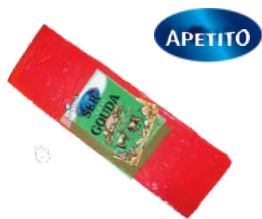
Ser Gouda blok opak.: ok. 3 kg