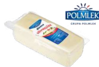
Ser Mozzarella blok