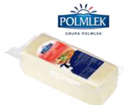
Ser grande pizza plus