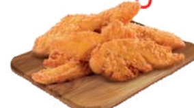
Stripsy z kurczaka