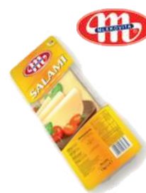
Ser salami plastry