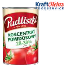
Koncentrat pom. 28-30% opak.: 950 g, 4500 g