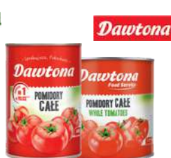
Pomidory całe bez skórki opak.: 400g, 2555g