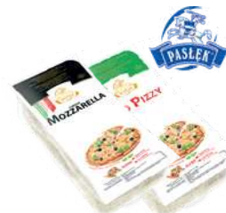
Mozzarella wiórki i kostka opak.: 2 kg