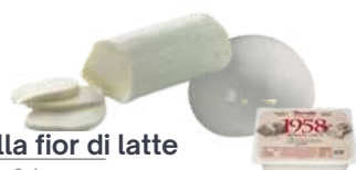
Mozzarella fior di latte

blok ok. 3 kg; kulka 3 kg; julienne 3 kg