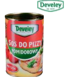
Sos do pizzy opak.: 4200 g