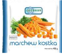
Marchew kostka opak.: 2,5 kg