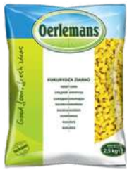
Kukurydza ziarno opak.: 2,5 kg