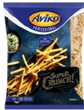
Super Crunch Pure & Rustic skin on 7mm