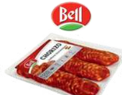
Kiełbasa chorizo plastry opak.: 500 g