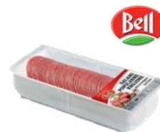
Salami plastry opak.: 1 kg