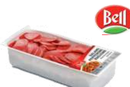
Salami dojrzewające krojone opak.: 1 kg