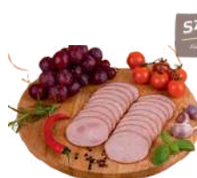
Szyńka na pizzę w plastrach opak.: ok. 1,5 kg