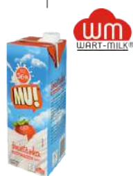
Mu! UHT 18% 30% 36%