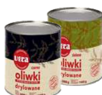
Oliwki zielone i czarne drylowane