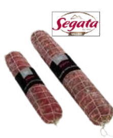
Salame napoli dolce