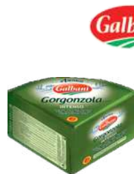
Ser Gorgonzola blok