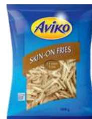
Skin On Fries 11mm