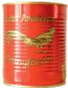
Koncentrat Złoty Bażant opak.: 850g, 4500g