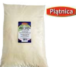
Mąka z pszenicy durum - semolina