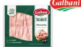
Mortadella opak.: 100 g