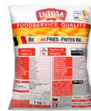
Lutosa frytka belgijska