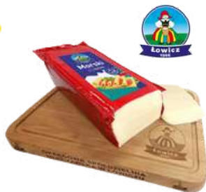
Ser Morski blok opak.: ok. 3 kg