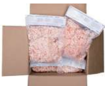
Krewetki koktajlowe opak.: 1 kg