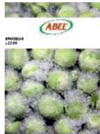
Brukselka opak.: 2,5 kg