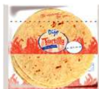
Tortilla pszenna 25, 30 cm