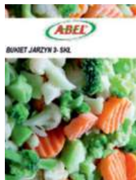
Bukiet jarzynowy 3-4 składnikowy opak.: 2,5 kg