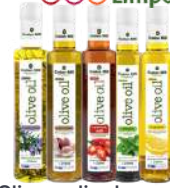
Oliwa z oliwek z bazylią, chilli, czosnkiem, rozmarynem, cytryną