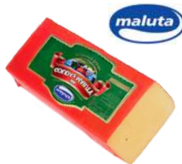
Ser Gouda blok opak.: ok. 3 kg