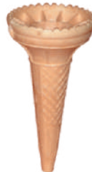
Rożek europejski szer.: 65, wys.: 125 260 szt., nr. 12