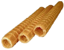
Rurka Włoska 100 szt. szer.: 16, wys.: 195