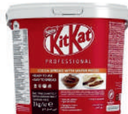
Krem KitKat opak.: 3 kg