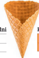
Rożek cukrowy Duży 144 szt. szer.: 84, wys.: 160