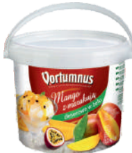
Mango z marakuja deserowa w żelu opak.: 3,2 kg