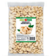
Orzechy nerkowca opak.: 1 kg, 25 kg