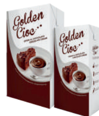
Czekolada na gorąco Golden cioc