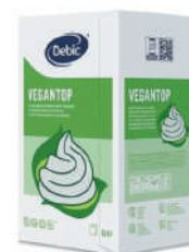
VEGANTOP 30% UHT