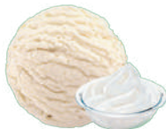
CREAM ZE ŚMIETANKA