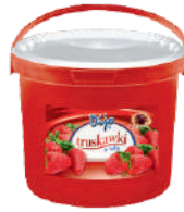
Truskawki w żelu opak.: 3,2 kg