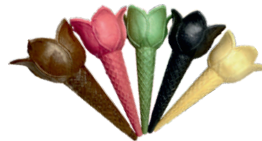
Polski tulipan czarne nr. 42, różowe nr. 41, brązowe nr. 37, tradycyjne nr. 21, zielone nr. 44 szer.: 61, wys.: 130 390 szt.