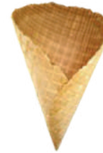
Tivoli XL wys.: 175 mm szer.: 100 mm 180 szt.