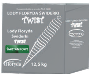
Lody floryda świderki TWIST śmietankowe opak.: 12,5 kg