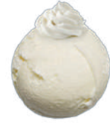
CREAM ZE ŚMIETNKA