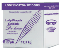
Lody floryda De Luxe waniliowe opak.: 12,5 kg