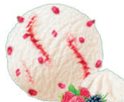
BEZOWE Z SOSEM OWOCE LEŚNE