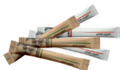
Cukier w saszetkach