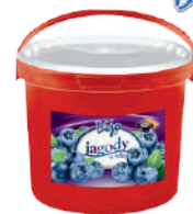
Jagody w żelu opak.: 3,2 kg