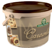
Gran Latte Nocciola opak.: 5 kg