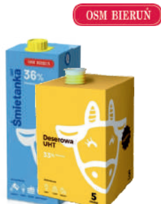
Deserowa 33% UHT Deserowa 36% UHT