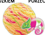
CAMELO O SMAKU TOFFIE