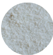
Wiórki kokosowe Medium/Fine opak.: 1 kg, 25 kg