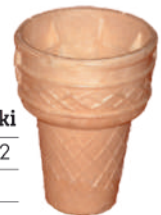
Kubek kanadyjski szer.: 52, wys.: 72 560 szt., nr. 2