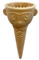
Małpka szer.: 49, wys.: 122 390 szt., nr. 55