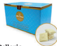
Bellaria Czekolada biała 28%