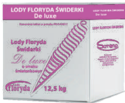
Lody floryda De Luxe śmietankowe opak.: 12,5 kg