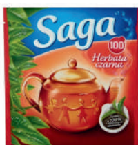
Saga Herbata czarna