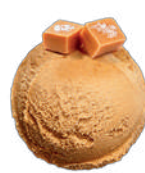
KARMEL Z SOLA