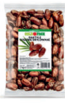
Daktyle suszone drylowane opak.: 1 kg, 25 kg