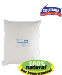
Śmietana świeża 30% i 36%