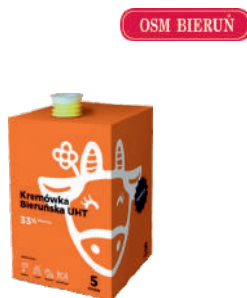
Kremówka BIERUŃSKA 33% UHT