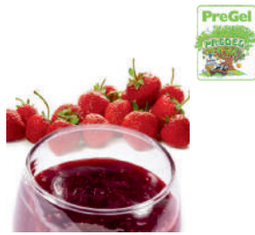
Pasta o smaku truskawkowym