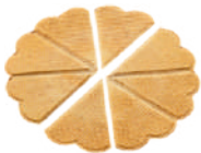
Wafle wachlarz SERCE średnica: 90 200 szt., nr. 23