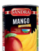
Mango plastry opak.: 425 g