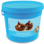
Krem orzechowy opak.: 5 kg