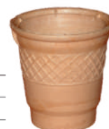
Kubek max szer.: 76, wys.: 78 208 szt., nr. 8