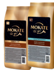
Gęsta czekolada / Napój czekoladowy