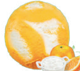
POMARAŃCZA Z TWAROŻKIEM