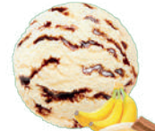
BANAN Z CZEKOLADA