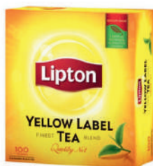
Lipton Herbata czarna