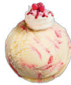
SMAK BEZOWY Z SOSEM MALINOWYM