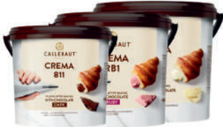
Kremy Callebaut z orzechami laskowymi, biała czekolada czekolada ruby, ciemna czekolada, gold opak.: 5 kg