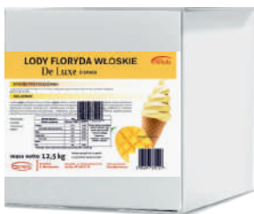
Lody floryda włoskie DE LUXE mango opak.: 12,5 kg