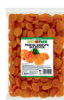
Morele suszone bez pestek opak.: 1 kg, 25 kg