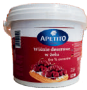
Wiśnie deserowe w żelu opak.: 3,2 kg