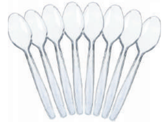
łyżeczki do lodów i gofrów