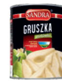
Gruszki połówki opak.: 2650 g