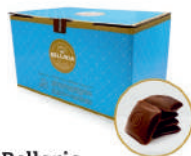
Bellaria Czekolada deserowa 34,5%