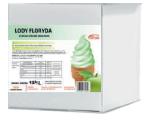
Lody floryda włoskie DE LUXE zielone jabłko opak.: 12,5 kg