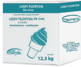
Lody floryda włoskie De Luxe śmietankowo - waniliowe opak.: 12,5 kg