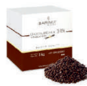
Czekolada deserowa 34% pastylki