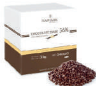
Czekolada deserowa 56% pastylki