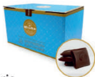
Bellaria Czekolada deserowa 56,5%