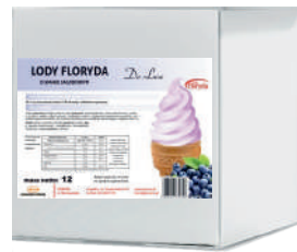
Lody floryda włoskie DE LUXE jagodowe opak.: 12,5 kg