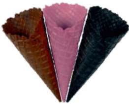
Rożek słodki średni czarny nr. 26, różowy nr. 32, brązowy nr. 29 wys.: 152, szer.: 55 304 szt.