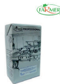
Mleko UHT 3,2%