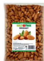
Migdały opak.: 1 kg, 25 kg