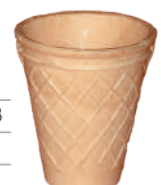
Kubek duży szer.: 76, wys.: 73 648 szt., nr. 6