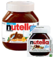
Ferrero Nutella opak.: 15 g, 600 g