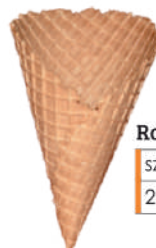
Rożek słodki duży szer.: 85, wys.: 170 216 szt., nr. 10