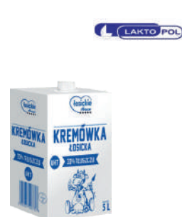
Śmietanka Łosicka 30, 33, 36% UHT