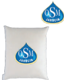
Śmietana świeża 36%