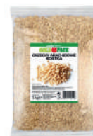
Orzechy arachidowe kostka opak.: 1 kg, 25 kg