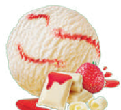
BIAŁA CZEKOLADA Z SOSEM TRUSKAWKOWYM