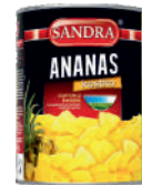
Ananas kostka opak.: 565 g, 3100 g