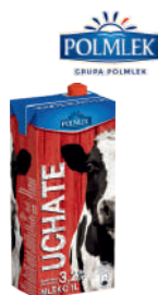
Mleko UHT 2% i 3,2%