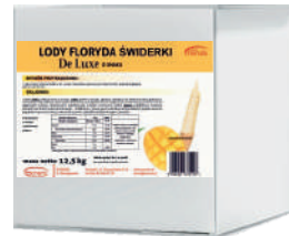
Lody floryda De Luxe mango opak.: 12,5 kg