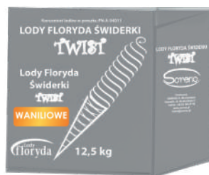
Lody floryda świderki TWIST waniliowe opak.: 12,5 kg