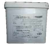
Krówka Śmieszka opak.: 12,5 kg