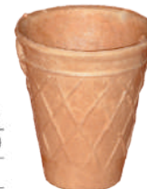
Kubek średni szer.: 76, wys.: 69 780 szt., nr. 5