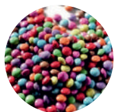
Posypka Smarties Mini