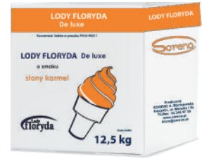
Lody floryda włoskie De Luxe słony karmel opak.: 12,5 kg