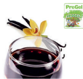
Pasta o smaku waniliowym