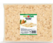
Migdały płatkі opak.: 1 kg, 25 kg