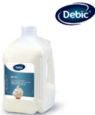
Baza do lodów włoskich płynna