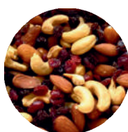
Mieszanka studencka opak.: 1 kg, 25 kg