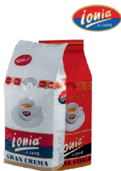
Ionia Gran crema, Cinque stella