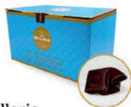
Bellaria Czekolada deserowa 55%