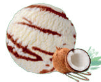
KOKOS Z SOSEM KAKAOWYM