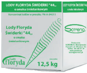
Lody floryda świderki 44 śmietankowe opak.: 12,5 kg