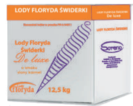
Lody floryda De Luxe słony karmel opak.: 12,5 kg

śmietankowe waniliowe czekoladowe jagodowe zielonejablko truskawkowe śmietankowo-karmelowe mango słony karmel