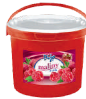
Maliny w żelu opak.: 3,2 kg