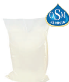
Mleko świeże 2% i 3,2%