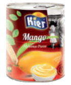
Pulpa mango opak.: 850 g