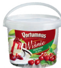
Wiśnia deserowa w żelu opak.: 3,2 kg