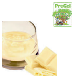
Pasta o smaku białej czekolady