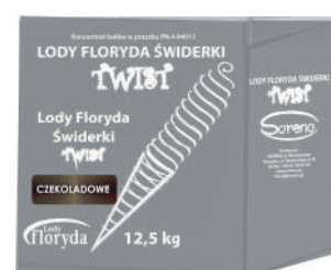
Lody floryda świderki TWIST czekoladowe opak.: 12,5 kg