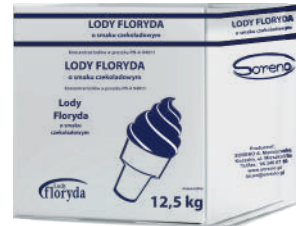
Lody floryda włoskie De Luxe czekoladowe opak.: 12,5 kg