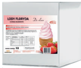
Lody floryda włoskie DE LUXE truskawkowe opak.: 12,5 kg