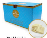
Bellaria Czekolada biała 33%