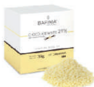
Czekolada biała 29% pastylki