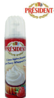
Śmietana w sprayu