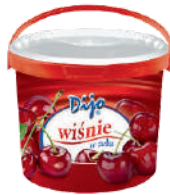
Wiśnie w żelu opak.: 3,2 kg