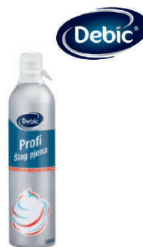
Śmietana w sprayu