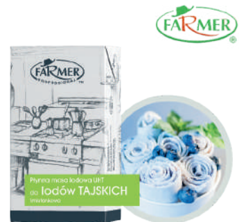
Masa lodowa do lodów tajskich