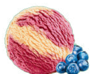
JAGODOWE O SMAKU CIASTECZKOWYM