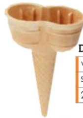
Double wys.: 70 mm szer.: 125 mm 252 szt.