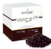
Czekolada deserowa 72% pastylki