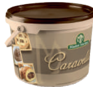
Caribe Nocciola opak.: 20 kg