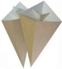
Rożki do bubble waffle