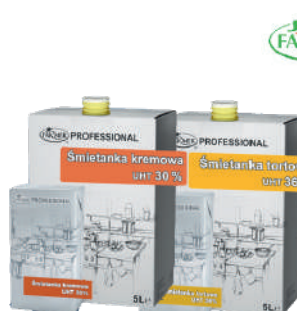
Śmietanka 30% UHT Śmietanka 36% UHT