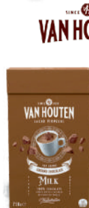
Czekolada do picia w proszku