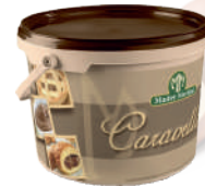
Gran Pistacchio opak.: 5 kg