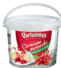
Czerwona porzeczka deserowa w żelu opak.: 3,2 kg