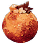
SŁONY KARMEL-CZEKOLADA Z ORZESZKAMI