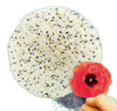
MAKOWE O SMAKU CIASTECZKOWYM