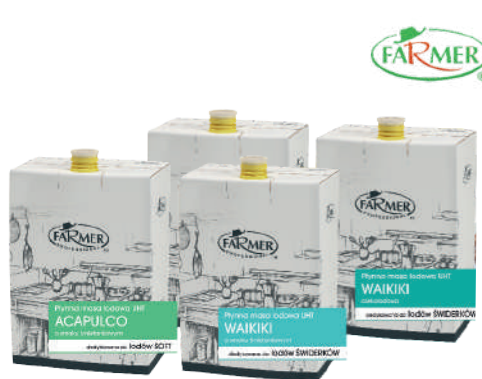
Acapulco masa lodowa