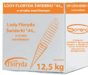
Lody floryda świderki 44 waniliowe opak.: 12,5 kg