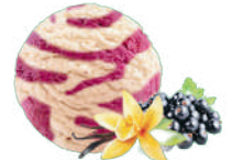
WANILIA Z SORBETEM PORZECZKOWYM