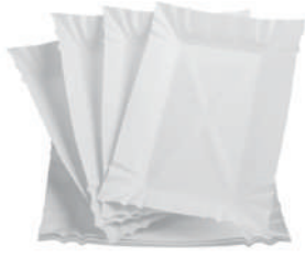
Tacki na gofry