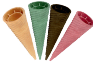
Rożek twister czarne nr. 34, różowe nr. 45, brązowe nr. 46, tradycyjne nr. 22, zielone nr. 47 szer.: 47, wys.: 130 184 szt.