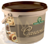
Gran Nocciola opak.: 5 kg, 13 kg