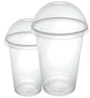
Kubki plastikowe z wieczkiem