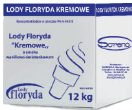
Lody floryda włoskie kremowe waniliowo - śmietankowe opak.: 12 kg