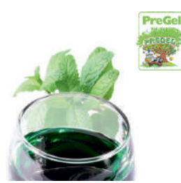
Pasta o smaku miętowym