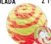
KWAŚNY URWIS O SMAKU JABŁKO TRUSKAWKA