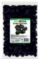
Śliwki suszone opak.: 1 kg, 25 kg