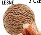
KARMEL Z SOLA