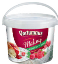
Malina deserowa w żelu opak.: 3,2 kg